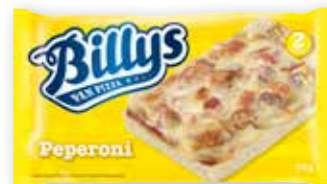
BILLYS PAN PIZZA PEPPERONI