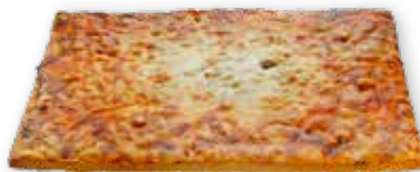
BILLYS GASTROPIZZA VEGETAR