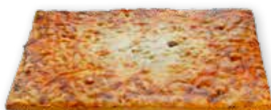
BILLYS GASTROPIZZA ORIGINAL OST & SKINKE