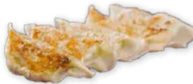
DUMPLINGS M/ GRØNTSAGER FROSTVARE 77678 13-14g 333stk/kolli (4,5kg)