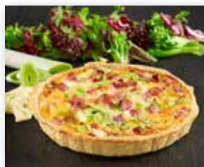
TÆRTE M/ SKINKE & OST