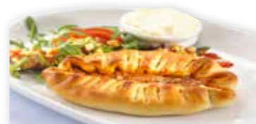
GORBY'S PIROG ORIGINAL

3197 (caterpakning) 130g 25stk/kolli (3,25kg)