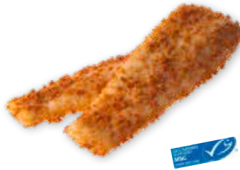
ALASKAFILET FROSTVARE Sprødstegt 6198 110-140g 40stk/kolli (5kg) Certifikat: MSC-C-51016