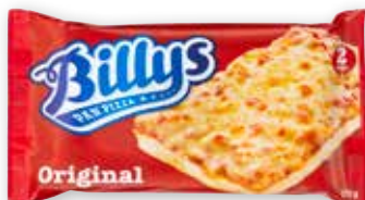
BILLYS PAN PIZZA ORIGINAL SKINKE & OST