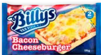
BILLYS PAN PIZZA BACON CHEESEBURGER

Alle vores færdigretter opbevares på frost!