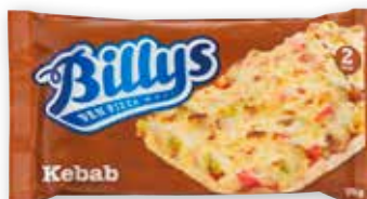
BILLYS PAN PIZZA KEBAB