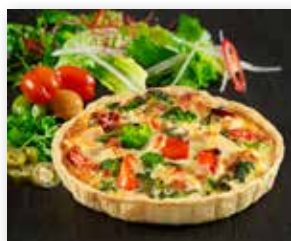
TÆRTE M/ KYLLING