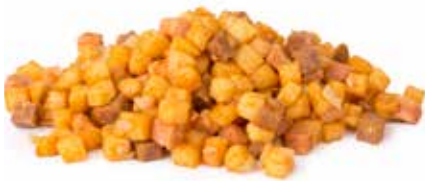
OXPYTT BIKSEMAD M/ OKSEKØD FROSTVARE 85902 5kg /kolli (5kg)

Vi har gjort det nemmere for køkkener med vores populære biksemad med oksekød i tern, friterede kartoffeltern og stegte løg.