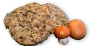
CHAMPIGNONBØF FROSTVARE Forstegt M19057063 80g 24stk/kolli (1,92kg)