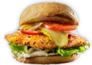
PANERET KYLLINGESCHNITZEL FROSTVARE 3650 160g ca.50stk/kolli (8kg)