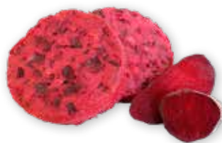
RØDBEDEBØF FROSTVARE Forstegt M19057022 80g 24stk/kolli (1,92kg)

Vores vegetariske bøffer er baseret på specielt udvalgte grøntsager og svampe, som giver dem en saftig og lækker smag!