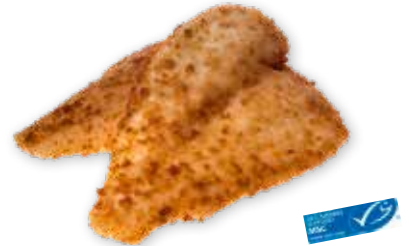
STILLEHAVSSPÆTTE FROSTVARE Sprødstegt 73344 140-180g 32stk/kolli (5kg) Certifikat: MSC-C-51016